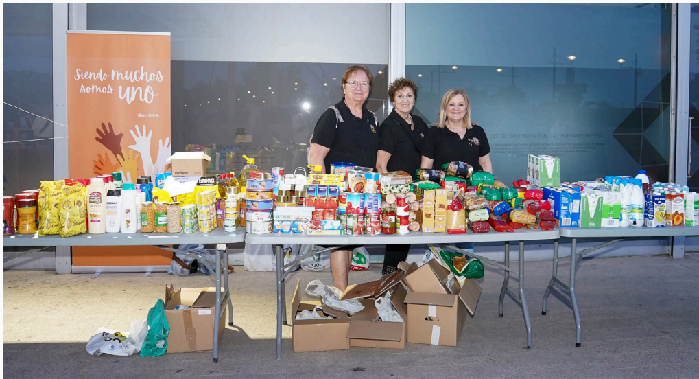
Mesa para la recogida de los productos de alimentación