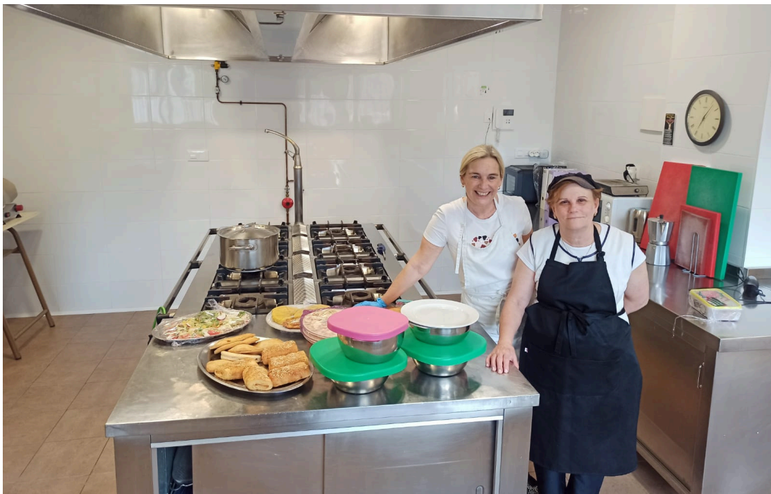
Instalaciones de la cocina del Preventorio Infantil Ntra. Sra. del Amparo