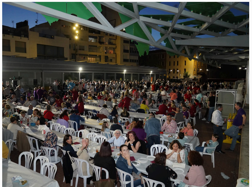
Vista general de la cena