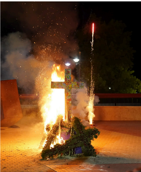
Momento de la purificación de las Cruces de Mayo