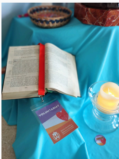
Ambientación de la oración