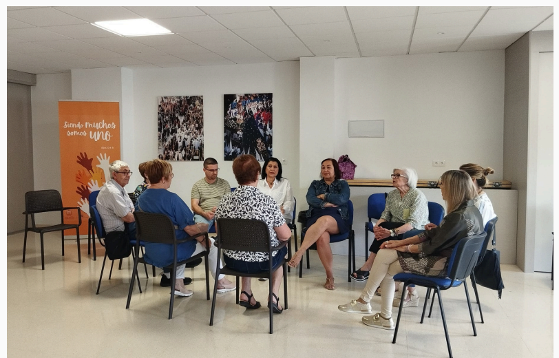
Equipos de trabajo